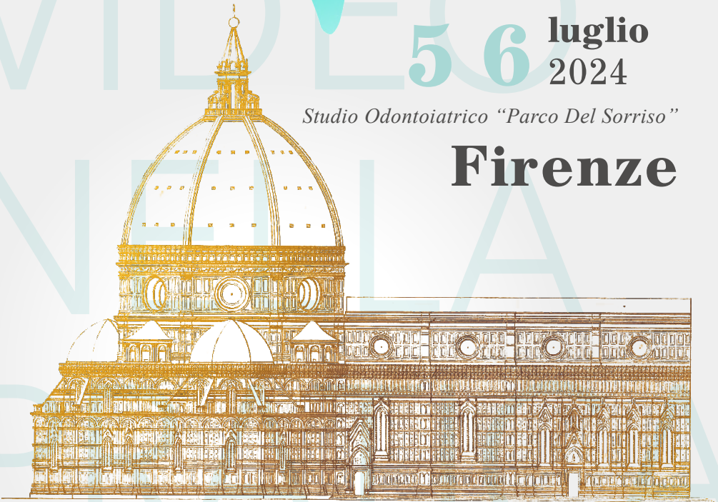
FOTO E VIDEO NELLA PRATICA CLINICA