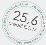
Foto e video nella pratica clinica

La fotografia medico/scientifica nasce come esclusivo strumento di condivisione e comunicazione in ambito medico.